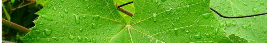
Participación según destino en las exportaciones de vino. Argentina. Noviembre 2017